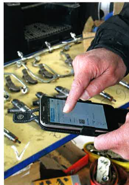
Mobiles WERBAS.blue: Die Nutzung via Tablet, Laptop und Handy ist möglich.

Trainings und Lernwege für die unterschiedlichen Zielgruppen an, hieß es. Ist nach der Schulung immer noch etwas unklar, so hilft das Servicetelefon. Die Hotline sei wochentags besetzt, priorisiere die Anfragen nach der Problemstellung und helfe mit kurzen Reaktionszeiten. Diese Vielfalt im Blick und die entsprechenden Systeme ständig am Laufen zu halten, und das noch zu günstigen Konditionen, ist eine weitere Herausforderung, der sich die WERBAS AG stellt. Im Rahmen der Automechanika zeigt WERBAS auch neue Funktionalitäten von WERBAS.blue. Mit einer mobilen Lösung sind ab sofort auch die Zeiterfassung und die Zuordnung zu den einzelnen Aufträgen via WLAN möglich, hieß es.